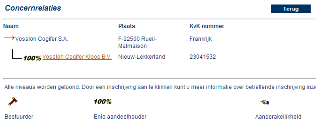
Figuur 1: Concernrelaties

Om organisatiegrens vast te stellen, is de leverancierslijst van Vossloh Cogifer Kloos geanalyseerd. De concernrelaties die in 2017 in de A-leverancierslijst van Vossloh Cogifer Kloos voorkomen, zijn zusterbedrijven; uitbreiding van de boundary door toevoegen van dit bedrijf is echter niet wenselijk; omdat daarvoor de bedrijven zowel geografisch als operationeel te veel van elkaar verschillen. Bovendien is de financiële invloed van Vossloh Cogifer Kloos zeer beperkt, vanwege een kleine verhouding inkoop tot totaalomzet van het moederbedrijf. De moeder- en zusterondernemingen worden daarom buiten beschouwing gelaten en alleen Vossloh Cogifer Kloos B.V. in de organisatiegrens opgenomen.